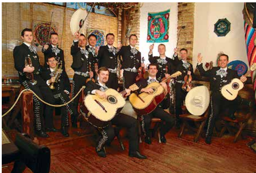
Mariachi Los Caballeros bodo nastopili 11. julija ob 21.30 na Trgu Ivana Roba v Šempetru pri Gorici.