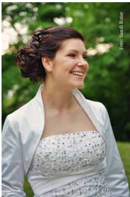
Pričeska Hiša lepih las.

trendi naravne in zelo sproščene pričeske, v Hiši lepih las pa temu naravnemu videzu radi dodajo kanček elegance: “Pri izboru prave pričeske je pomembnih več dejavnikov, v prvi vrsti je pomembna nevesta, njen karakter in njene